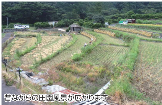
昔ながらの田園風景が広がります

戸田の新たな地区には、北山の棚田とよばれる棚田があります。日本の棚田100選に選ばれており、山肌一面に田んぼが広がる、ダイナミックな景観が楽しめます。