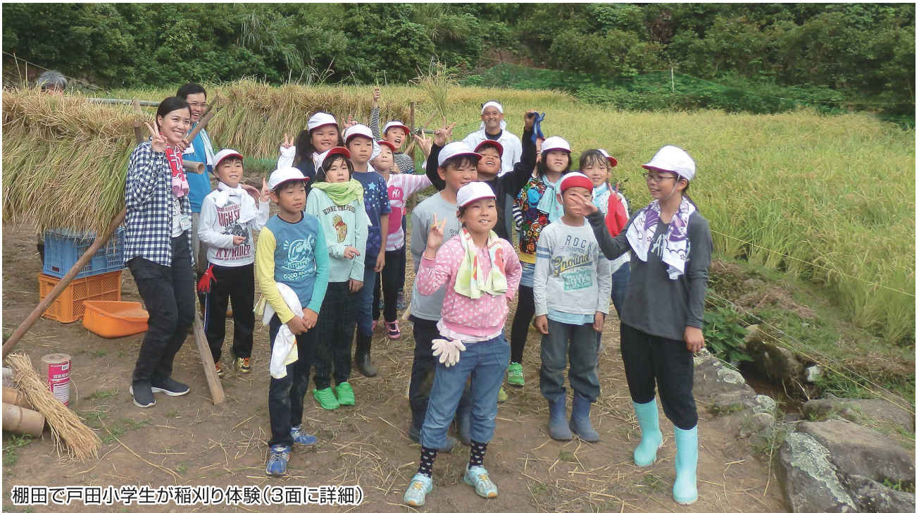
棚田で戸田小学生が稲刈り体験(3面に詳細)

No. 95 発行者 沼津市商工会 会長 大村保二 〈本所・原支所〉沼津市原1200番地の1 TEL(055)966-1331 FAX (055)967-4925 〈戸田支所〉沼津市戸田1028番地の5 TEL(0558)94-2224 FAX (0558)94-4029 編集 沼津市商工会広報委員会